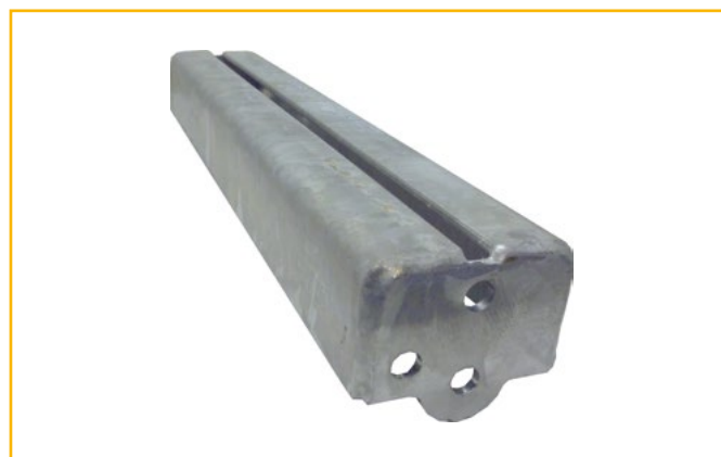
TYPE G • Tussensteun - Support intermediaire

* doorbuigingsvoorwaarde - condition de déflexion 1/200